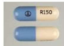
Pradaxa 150 毫克胶囊

MAQI2 (Michigan Anticoagulation Quality Improvement Initiative) ® Dabigatran(Pradaxa )