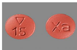
Xarelto pastillas de 15 mg